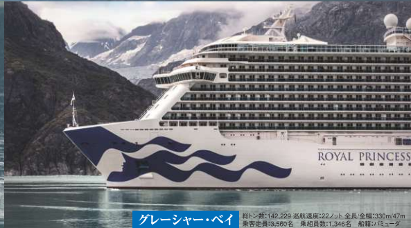
グレイシャー・ベイ 総トン数:142,229 巡航速度:22ノット 全長:330m/47m 乗客定員:9,560名 乗組員数:1,346名 船種:ミューダ