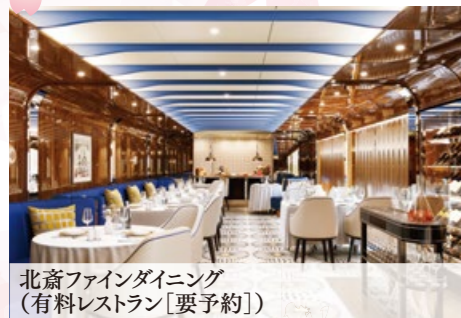
北斎ファインダイニング (有料レストラン[要予約])