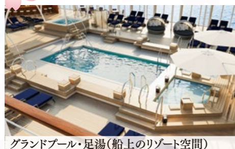
グランドプール・足湯(船上のリゾート空間)