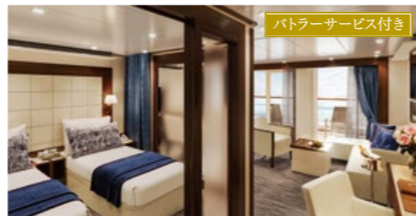
ペントハウススパスイート 48.8~49.4㎡ ベランダ付 デッキ10(10階)