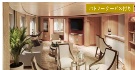
ラグジュアリースイート[A・B] 55.7~87.0㎡ ベランダ付 デッキ6・7・8(6・7・8階)