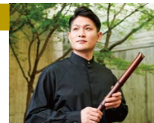
瀧北崇山(尺八奏者)