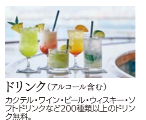
ドリンク(アルコール含む) カクテル・ワイン・ビール・ウイスキー・ソフトドリンクなど200種類以上のドリンク無料。