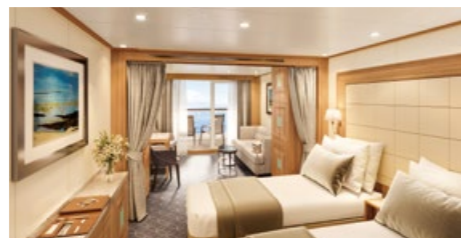
ベランダスイート[A~F] 24.4~30.2㎡ ベランダ付 デッキ5~10(5~10階)