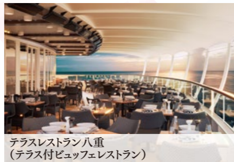
テラスレストラン八重 (テラス付ビュッフェレストラン)