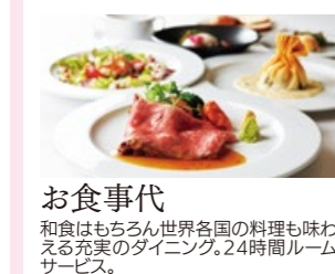
お食事代 和食はもちろん世界各国の料理も味わえる充実のダイニング。24時間ルームサービス。

商船三井の伝統を引き継ぐおもてなし サクラ・インクルーシブ~旅行代金に含まれるサービス~