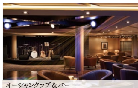
オーシャンクラブ&バー