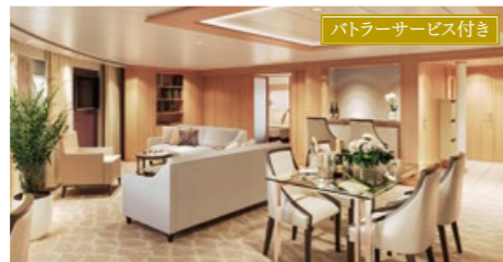
シグネチャースイート 87.0㎡ ベランダ付 デッキ7(7階)