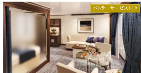
ペントハウススイート 39.7~54.8㎡ ベランダ付 デッキ6・9・10(6・9・10階)