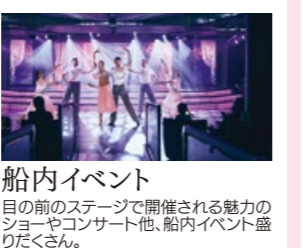
船内イベント 目の前のステージで開催される魅力のショーやコンサート他、船内イベント盛りだくさん。

サンロク 三六スイート(ペントハウス以上) ご滞在のお客様のプレミアムサービス ●ウェルカムシャンパンとウェルカムスイーツをご用意 ●「レストラン桜」専用エリアでのお食事 ●ダイニングルームのお食事をお部屋にお届け ●至れり尽くせりのバトラーサービス ●ランドリーサービス ●Wi-Fiインターネット無料サービス