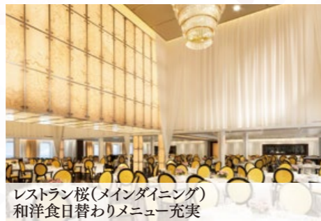
レストラン桜(メインダイニング) 和洋食日替わりメニュー充実